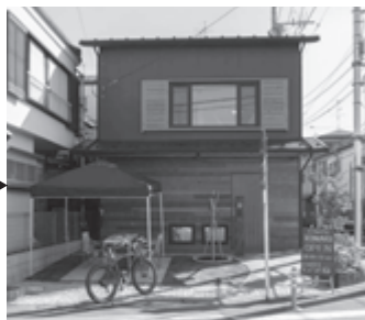
モデルハウスKINARI。お近くにお越しの際は、お気軽にお立ち寄りください。