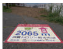
柳瀬川周回コースで、カッパに会えるかな？