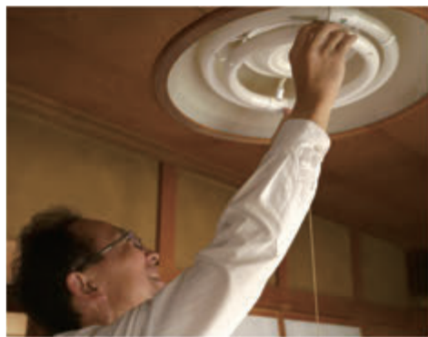
高齢者の電球交換に潜むリスクは転倒です。骨折など大きな怪我につながってしまうこともございますので、無理は禁物です...！

「蛍光灯が点いたり、消えたりして、球が切れそうなんです。」とご近所のおばあちゃんからのご相談。お宅へお伺いして、球の購入サポートから付け替えまで、作業させていただきました。