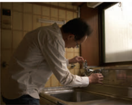
蛇口交換とあわせて、浄水器付の水栓へ付け替えると、わざわざ水を購入しなくて済みますしより美味しく安全にお米を炊けます！