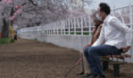
散歩中のおばあちゃんが隣に。心で会話をしました。

昔はフェンスもなく開放的で、春になると沢山の人で賑わっていた柳瀬川沿。今では護岸工事が行われ、昔ほど人の賑わいも少なくなったなあ...と町の移り変わりをしみじみと感じました。実は、ランニングやウォーキングができる柳瀬川周回コースがあるんですよ！