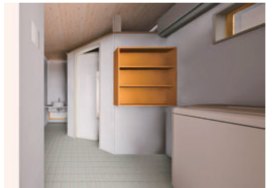
1階の家事スペース