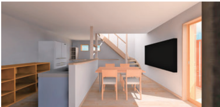
リビング（奥に見えるのは2階への階段）