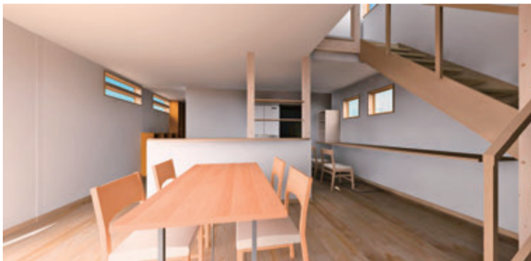
1階の階段前からリビングを見る（奥には家事スペースがあります）