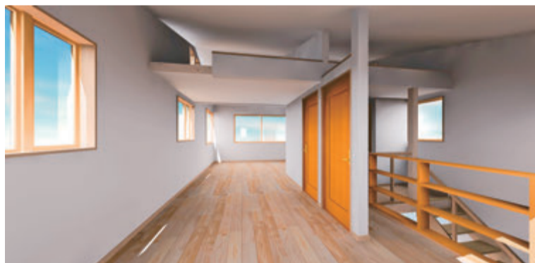
2階の居室（天気の良い日は奥の窓から富士山が見えます）