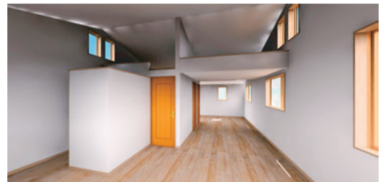
2階の居室（中央上段にあるのはロフトです）