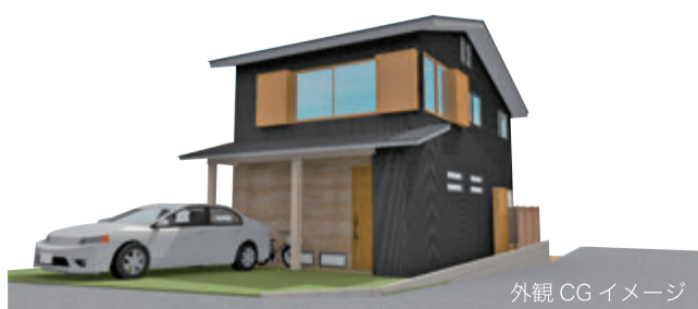
外観 CG イメージ

モデルハウス住所 〒354-0011 埼玉県富士見市水子3633-2 TEL：048-473-5333 (荒引工務店)